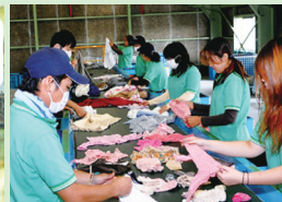
山本清掃京丹波ウエス