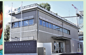
京都環境保全公社株式会社(本社)