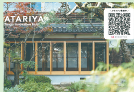
ATARIYA Tango Innovation Hub